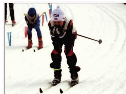
RISLE, RASLE: Her kommer skigruppa til Hasle!